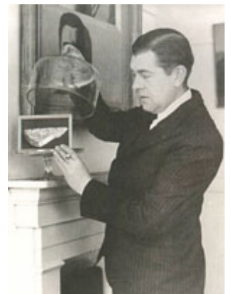
La peinture d'un morceau de fromage sous une cloche à fromage Ceci est un morceau de fromage, 1936-1937